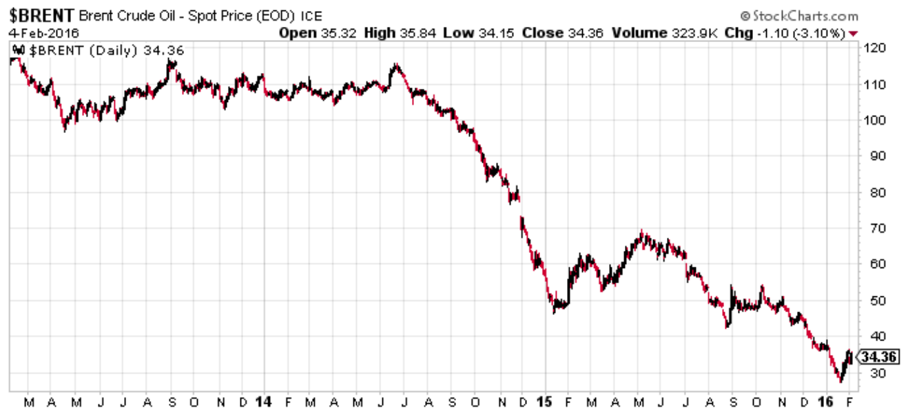
Chart: Brent-Öl 3 Jahre

Nach dem Platzen der Immobilienblase entdeckte die Wallstreet den U.S. Energiesektor als neue Einnahmequelle. Aufgebaut war die so genannte „Shale-Revolution“ auf langfristigen Ölpreisen von 100 Dollar pro Barrel und konstantem Produktionswachstum. Endlos billiges Geld der Fed und die verzweifelte Jagd der Investoren nach Rendite im Nullzinsumfeld, befeuerten einen beispiellosen Kreditboom. Wallstreet-Banken halfen im Gegenzug für satte Provisionen hunderten Shale-Produzenten bei der Platzierung von Hochzinsanleihen (Junk-Bonds) und Aktien. Allein die Summe der noch ausstehenden Junk-Bonds beläuft sich auf mehr als 300 Milliarden Dollar.