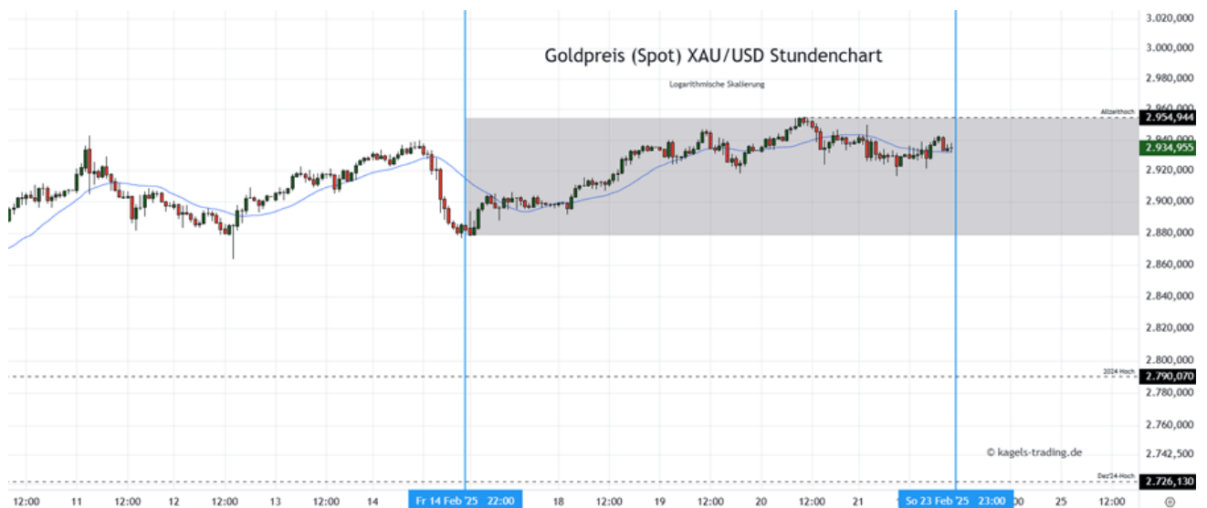
Goldpreis Prognose: Kurs im Stundenchart

In der vergangenen Woche konnte der Goldpreis die jüngsten Gewinnmitnahmen ausgleichen und die Aufwärtstrendstruktur mit einem nächsten Allzeithoch fortsetzen. Die Dynamik ist am Ende etwas abgeflaut, im Schlusskurs bleiben neue Rekordwerte aber in Schlagdistanz. Kurz vor der interessanten 3.000er $-Marke könnte die moderate Aufwärtstendenz zunächst in eine breitere Konsolidierung drehen, wobei zum Wochenstart am Montag bereits die Verbraucherpreisdaten erste Impulse liefern würden.