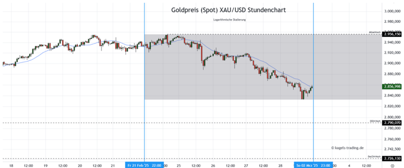
Goldpreis Prognose: Kurs im Stundenchart

In der vergangenen Woche konnte der Goldpreis zwar noch zaghaft ein nächstes Allzeithoch setzen, ist dann jedoch in eine Phase von Gewinnmitnahmen übergegangen. Am Ende konnte zum Vorwochentief bei 2.832 $ noch ein Polster an der 2.850er $-Marke gehalten werden. Damit wäre zum Start in die neue Woche am Montag abzuwarten, ob genug Nachfrage für eine Stabilisierung am aktuellen Kursniveau vorhanden ist.