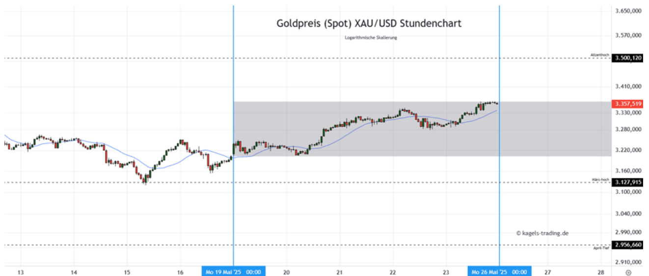
Goldpreis Prognose: Kurs im Stundenchart

Von seinem jüngsten Allzeithoch an der markanten 3.500er $-Marke hat der Goldpreis nach unten gedreht und in Richtung der 3.100er $-Marke korrigiert. Ausgehend vom März-Hoch zeigt sich nun eine Erholungsbewegung, die zum Ende der vergangenen Woche fest über der 3.330er $-Marke schließen konnte. Damit steht der Wochenstart am Montag unter positiven Vorzeichen, sodass der Bereich um 3.400 $ in Schlagdistanz geraten könnte.