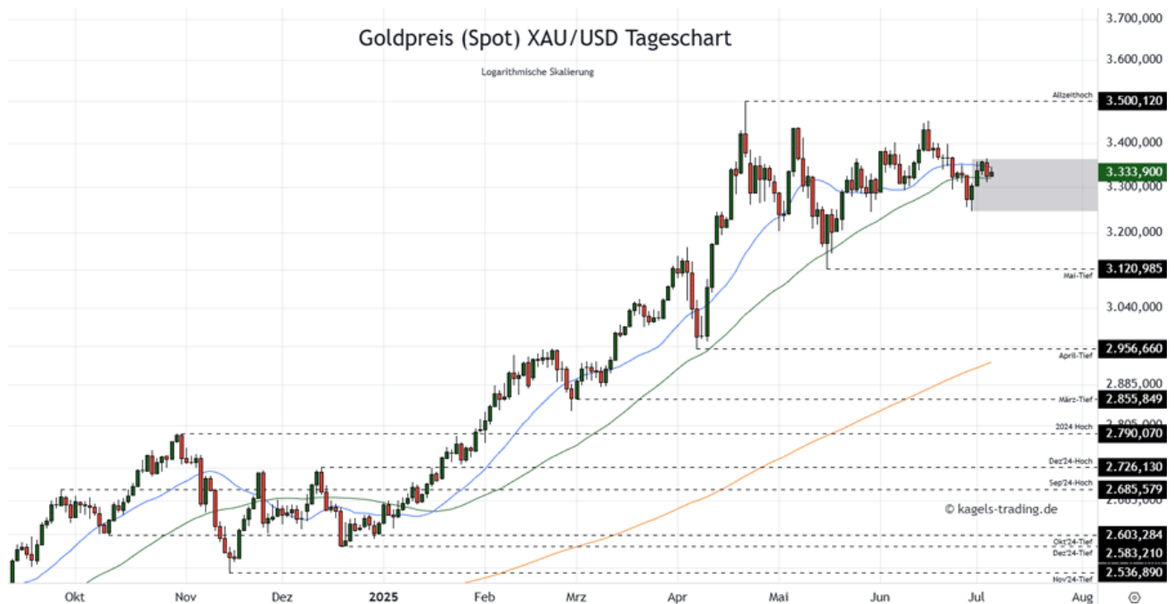
Goldpreis Prognose Tageschart - diese & nächste Woche

➤ Mögliche Wochenspanne: 3.390 $ bis 3.570 $ alternativ 3.090 $ bis 3.270 $