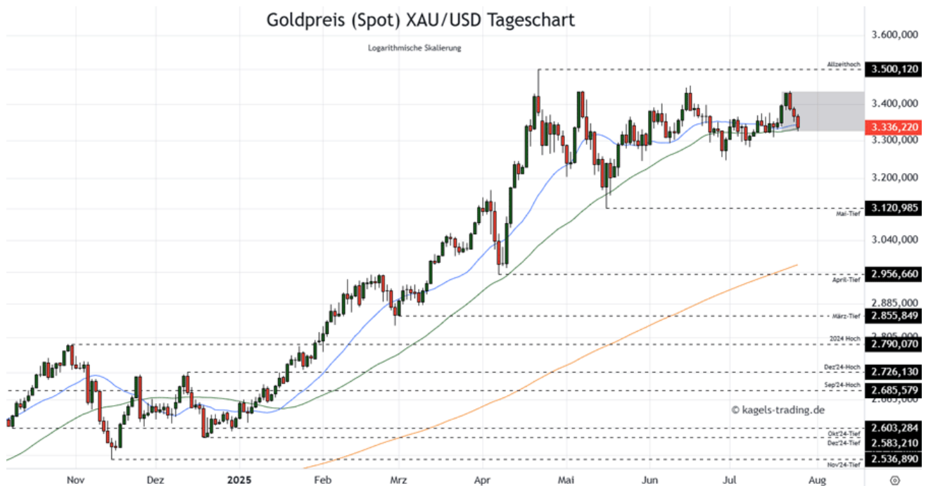
Goldpreis Prognose Tageschart - diese & nächste Woche

➤ Mögliche Wochenspanne: 3.160 $ bis 3.320 $ alternativ 3.360 $ bis 3.520 $