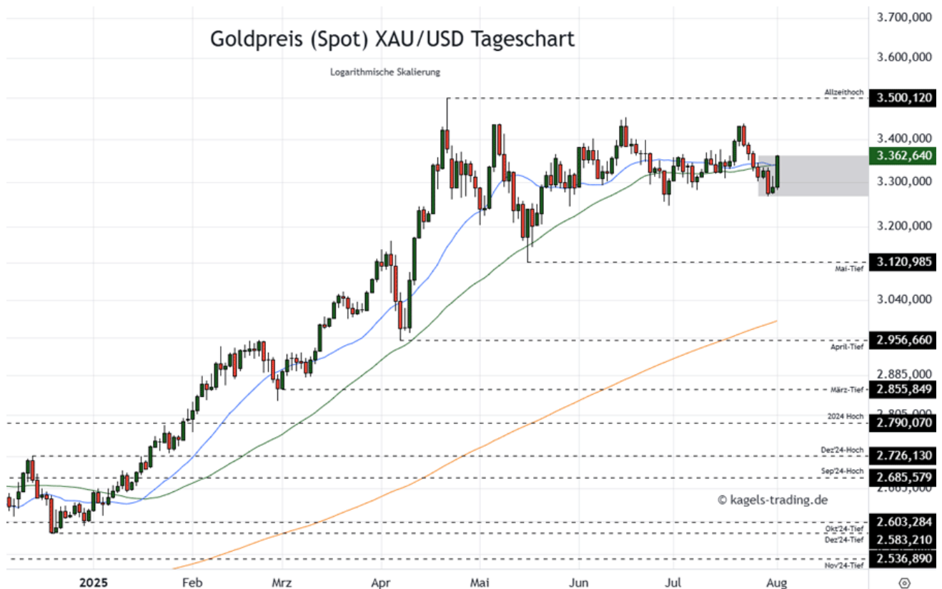
Goldpreis Prognose Tageschart - diese & nächste Woche

➤ Mögliche Wochenspanne: 3.390 $ bis 3.560 $ alternativ 3.290 $ bis 3.430 $