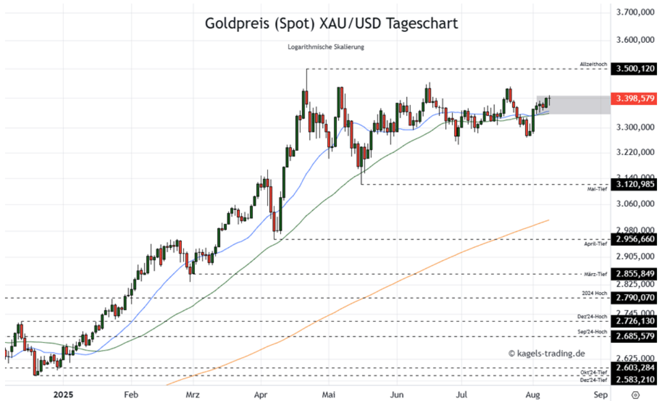
Goldpreis Prognose Tageschart - diese & nächste Woche

&#149; Mögliche Wochenspanne: 3.410 $ bis 3.540 $ alternativ 3.330 $ bis 3.450 $