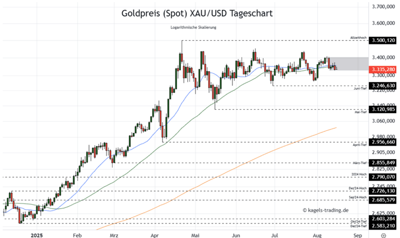
Goldpreis Prognose Tageschart - diese & nächste Woche (Chart: TradingView )

➤ Mögliche Wochenspanne: 3.210 $ bis 3.320 $ alternativ 3.240 $ bis 3.330 $