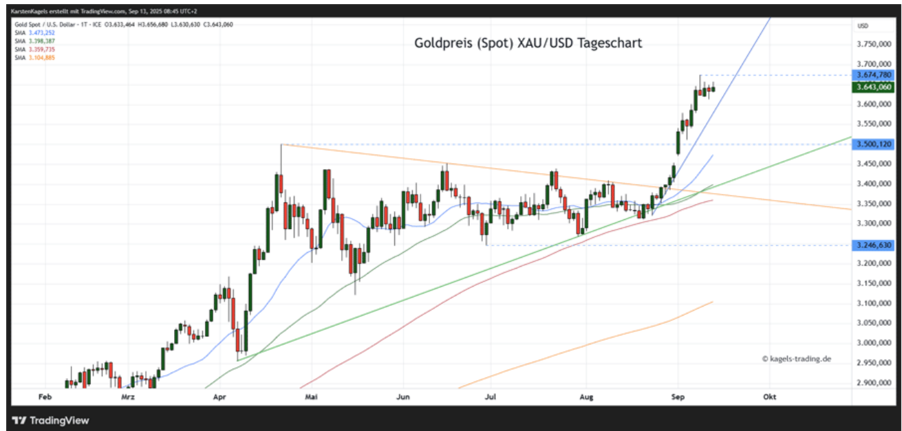
Goldpreis Prognose Tageschart - diese & nächste Woche (Chart: TradingView )

☞ Mögliche Wochenspanne: 3.590 $ bis 3.710 $