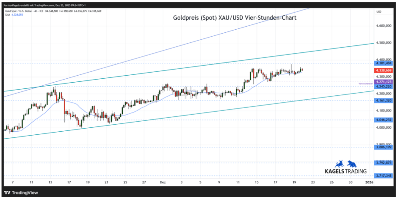
Goldpreis Prognose: Kurs im Stundenchart

&#149; Wichtige Unterstützungen: 4.271 | 4.245 $ | 4.161 $