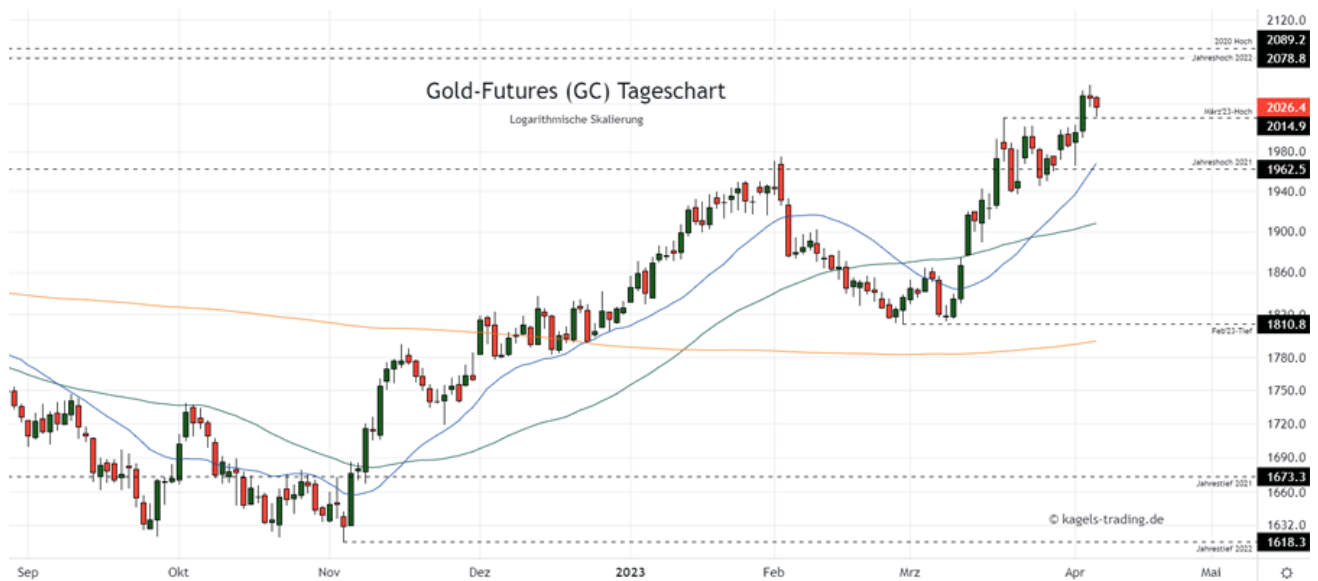
Goldpreis Chartanalyse: Kurs hat das Hoch aus dem März herausgenommen

Unterstützung am März-Hoch gehalten. Daraus ergibt sich ein starkes Signal, um das Ziel im Bereich der 2.080 $ anzulaufen. Kurzfristig stützt die Basis um das Jahreshoch aus 2021 dieses Szenario nun zusammen mit dem 20-Tage-Durchschnitt.