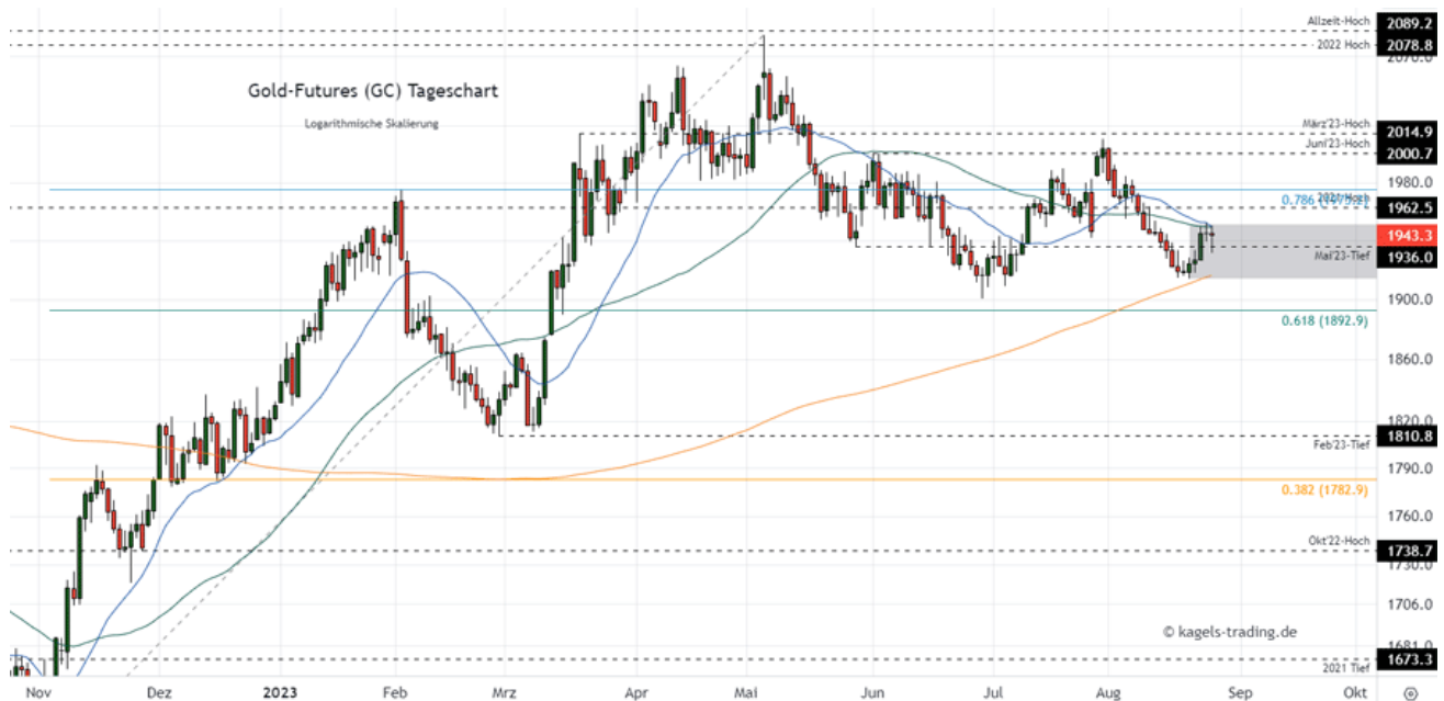
Goldpreis Prognose Tageschart – diese & nächste Woche

&#149; Mögliche Wochenspanne: 1.925 $ bis 1.985 $