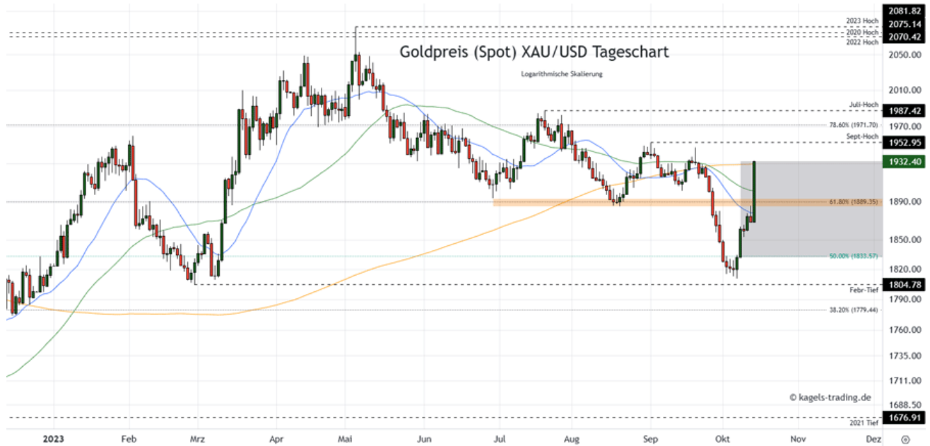
Goldpreis Prognose Tageschart – diese & nächste Woche

&#149; Mögliche Wochenspanne: 1.890 $ bis 1.990 $