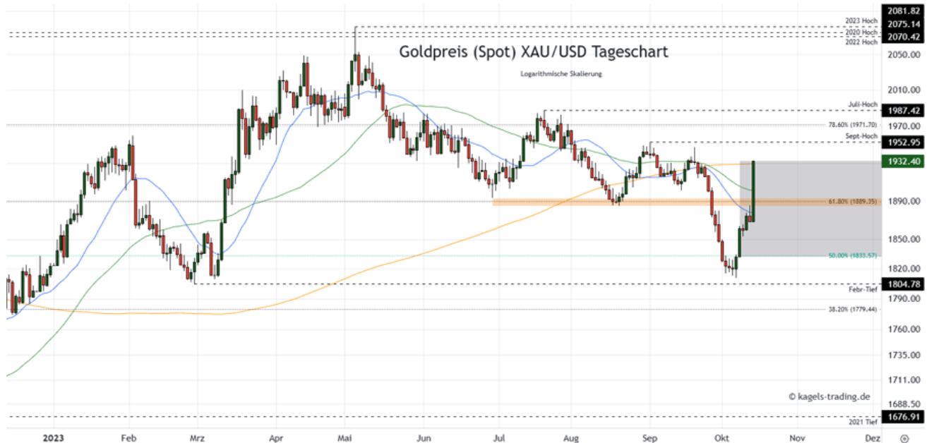
Goldpreis Prognose Tageschart – diese & nächste Woche

&#149; Mögliche Wochenspanne: 1.890 $ bis 1.990 $