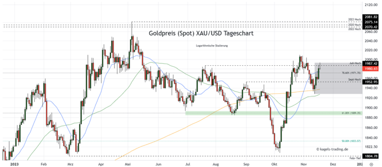
Goldpreis Prognose Tageschart – diese & nächste Woche

➤ Mögliche Wochenspanne: 1.950 $ bis 2.010 $