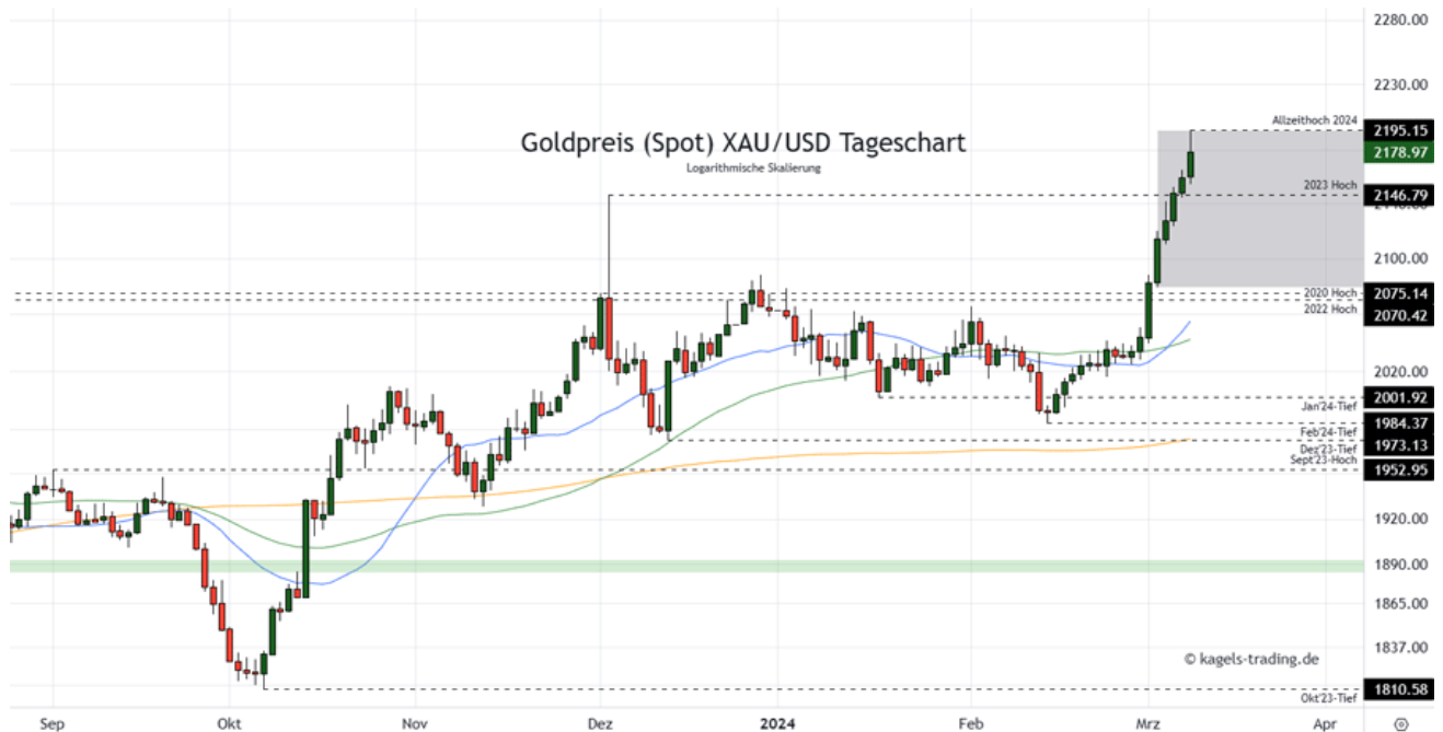
Goldpreis Prognose Tageschart – diese & nächste Woche (Chart: TradingView )

&#149; Mögliche Wochenspanne: 2.120 $ bis 2.240 $