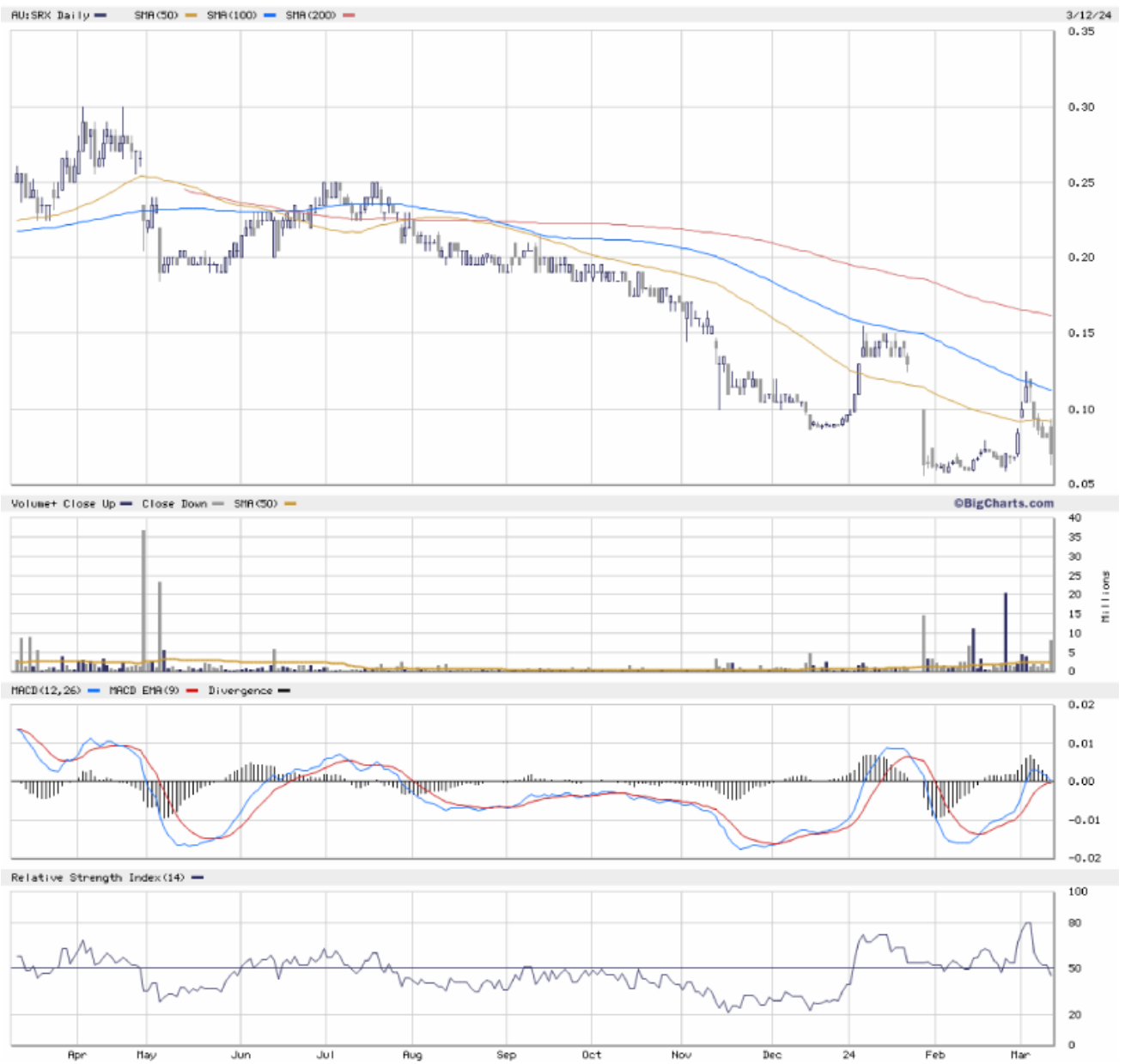
Chart Sovereign Metals: