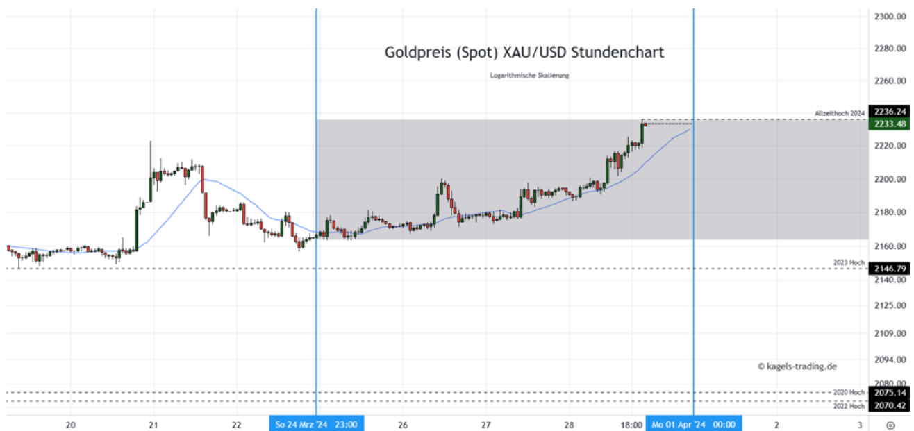
Goldpreis Prognose: Kurs im Stundenchart

Mögliche Tagesspanne: 2.220 $ bis 2.245 $