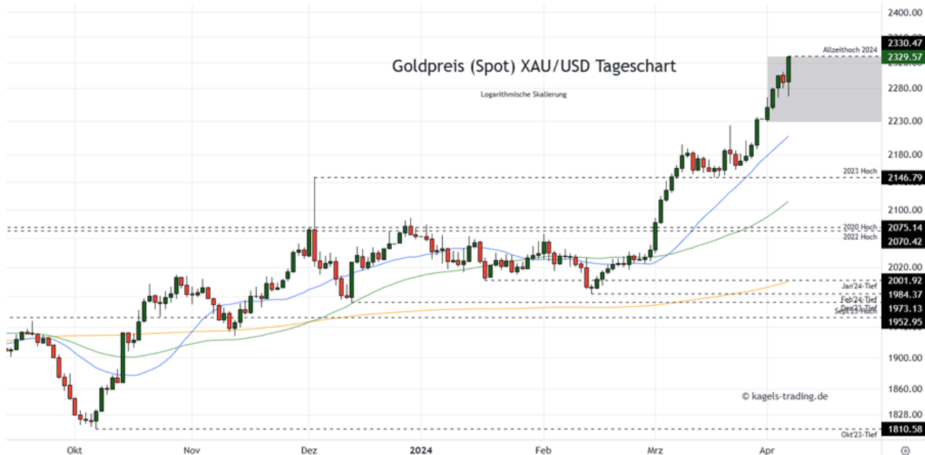
Goldpreis Prognose Tageschart – diese & nächste Woche (Chart: TradingView )

➤ Mögliche Wochenspanne: 2.270 $ bis 2.380 $