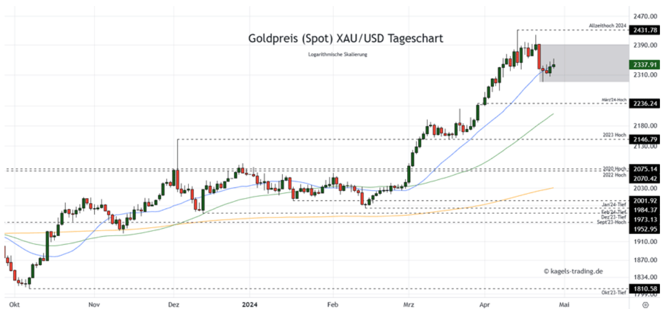
Goldpreis Prognose Tageschart – diese & nächste Woche

➤ Mögliche Wochenspanne: 2.200 $ bis 2.340 $