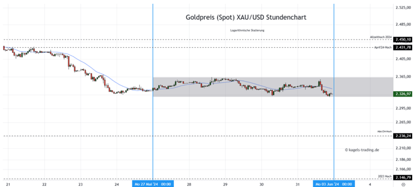
Goldpreis Prognose: Kurs im Stundenchart (Chart: TradingView )

&#149; Mögliche Tagesspanne: 2.305 $ bis 2.340 $