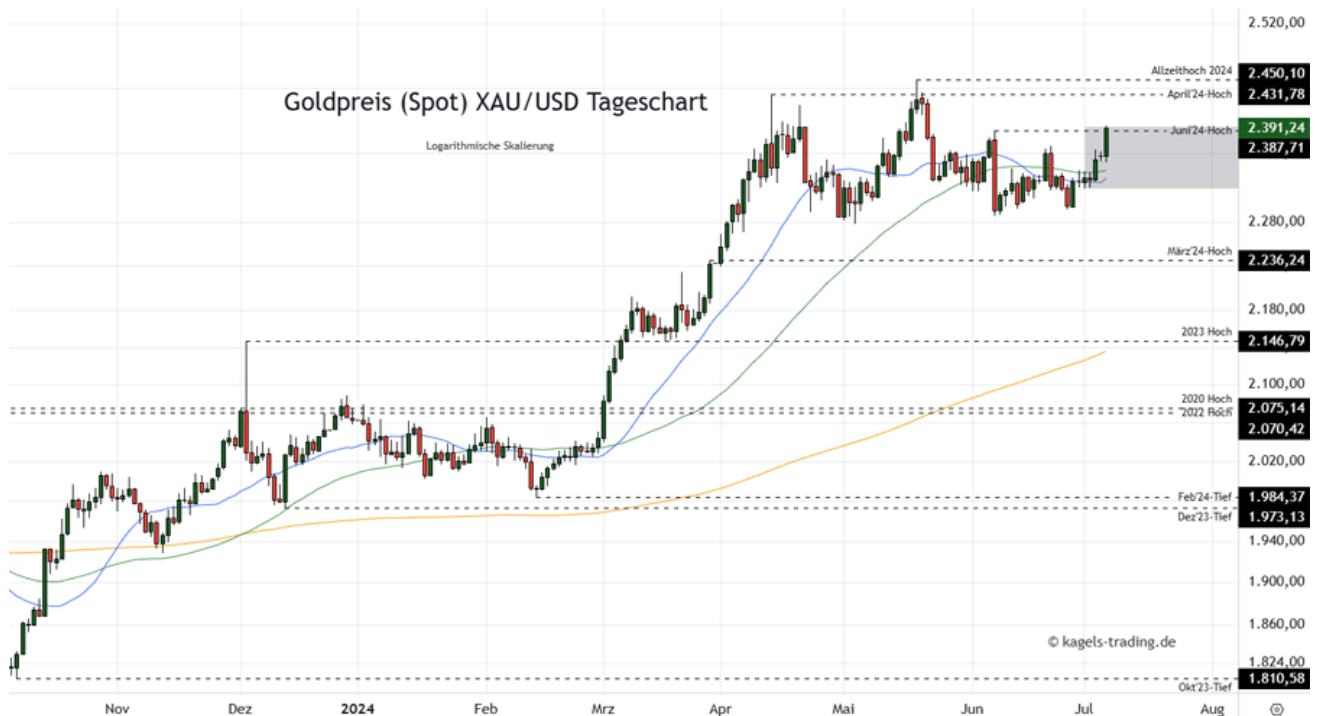
Goldpreis Prognose Tageschart – diese & nächste Woche

&#149; Mögliche Wochenspanne: 2.390 $ bis 2.480 $