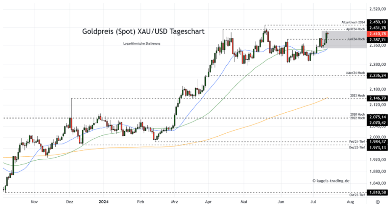
Goldpreis Prognose Tageschart – diese & nächste Woche (Chart: TradingView )

&#149; Mögliche Wochenspanne: 2.395 $ bis 2.470 $ alternativ 2.420 $ bis 2.510 $