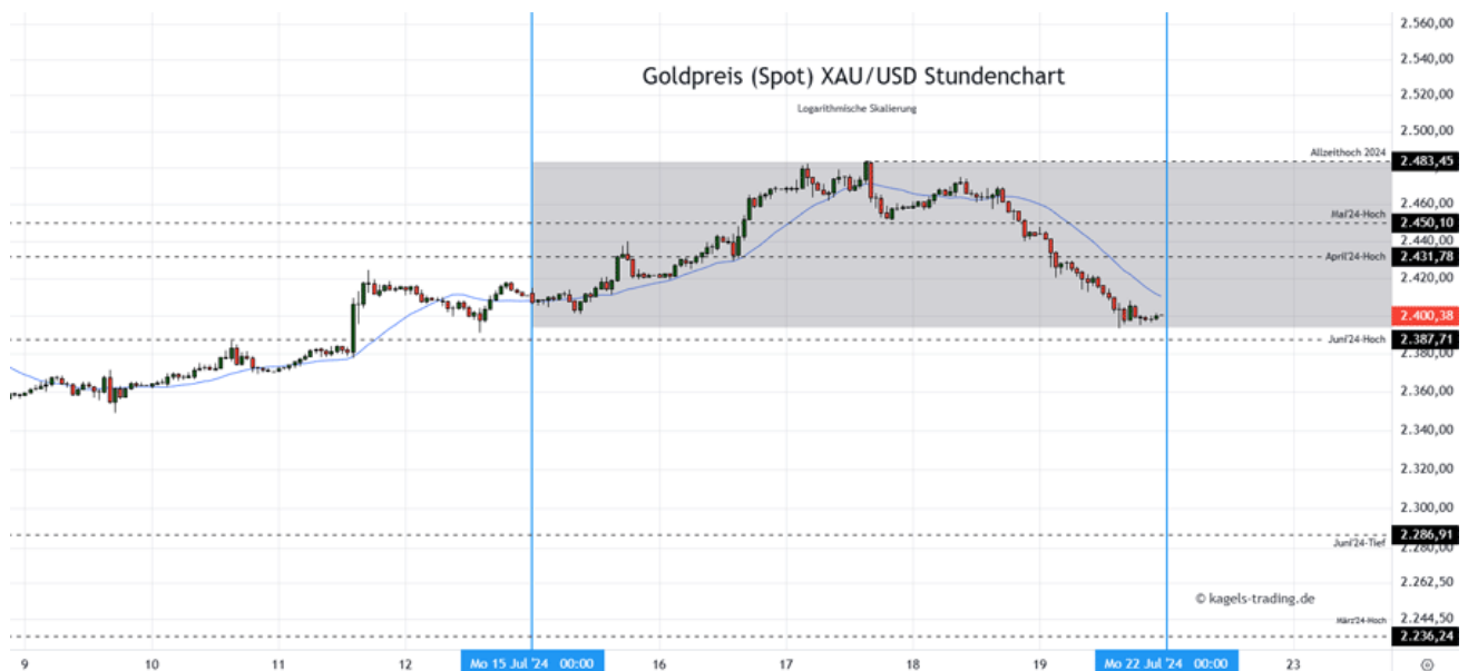
Goldpreis Prognose: Kurs im Stundenchart

Mögliche Tagesspanne: 2.380 $ bis 2.415 $