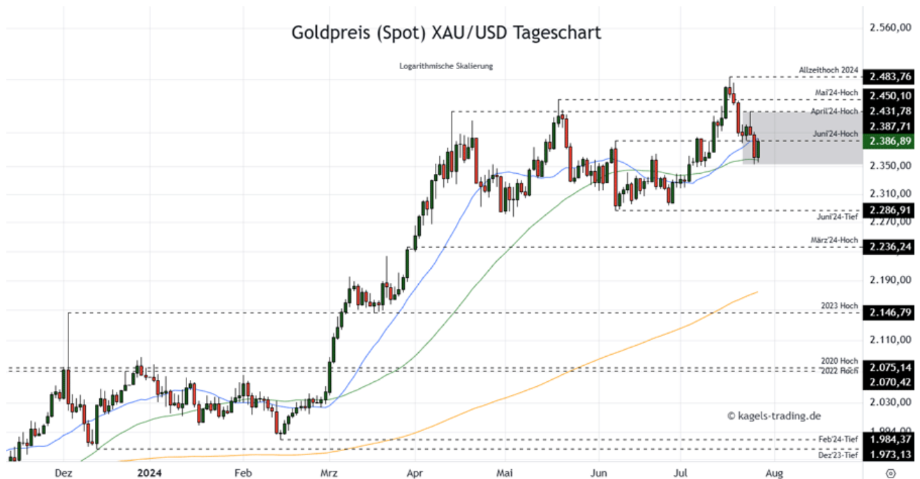
Goldpreis Prognose Tageschart – diese & nächste Woche (Chart: TradingView )

&#149; Mögliche Wochenspanne: 2.280 $ bis 2.370 $ alternativ 2.365 $ bis 2.450 $