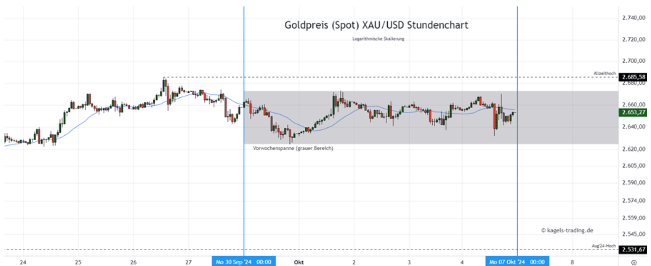
Goldpreis Prognose: Kurs im Stundenchart

In der vergangenen Woche hat der Goldpreis eine anfängliche Schwäche abgeschüttelt und im weiteren Verlauf eine Konsolidierung ausgebildet. Damit bleibt die 2.700er $-Marke in Reichweite. Da zum Wochenbeginn keine bewegenden Wirtschaftstermine anstehen, dürfte sich auch der Start in die neue Woche stabil gestalten und der Kurs am Montag Notierungen über 2.640 $ verteidigen.