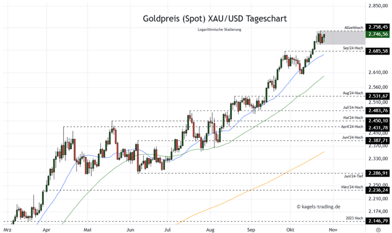
Goldpreis Prognose Tageschart - diese & nächste Woche (Chart: TradingView )

&#149; Mögliche Wochenspanne: 2.740 $ bis 2.810 $ alternativ 2.700 $ bis 2.745 $