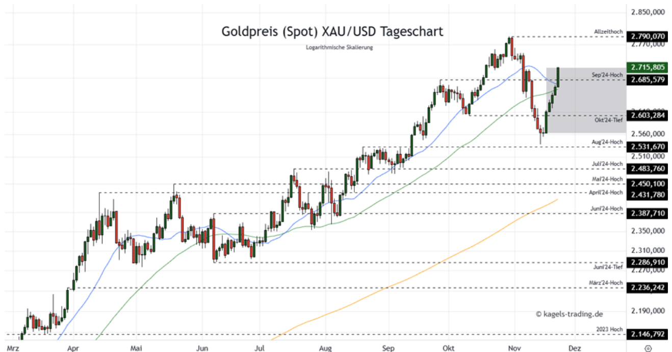
Goldpreis Prognose Tageschart - diese & nächste Woche

⚡; Mögliche Wochenspanne: 2.700 $ bis 2.810 $ alternativ 2.740 $ bis 2.870 $