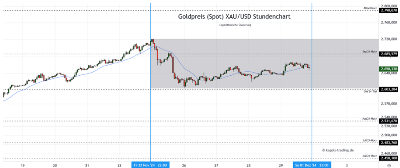
Goldpreis Prognose: Kurs im Stundenchart (Chart: TradingView )

In der vergangenen Woche hat der Goldpreis zuerst einen Korrekturimpuls gezeigt, sich im weiteren Verlauf am Oktobertief gestützt und eine leichte Erholung durchlaufen. Zum Wochenstart am Montag bleibt zunächst abzuwarten, ob das Polster zum Vorwochentief nach dem langen US-Feiertagswochenende weiter ausgebaut werden kann.