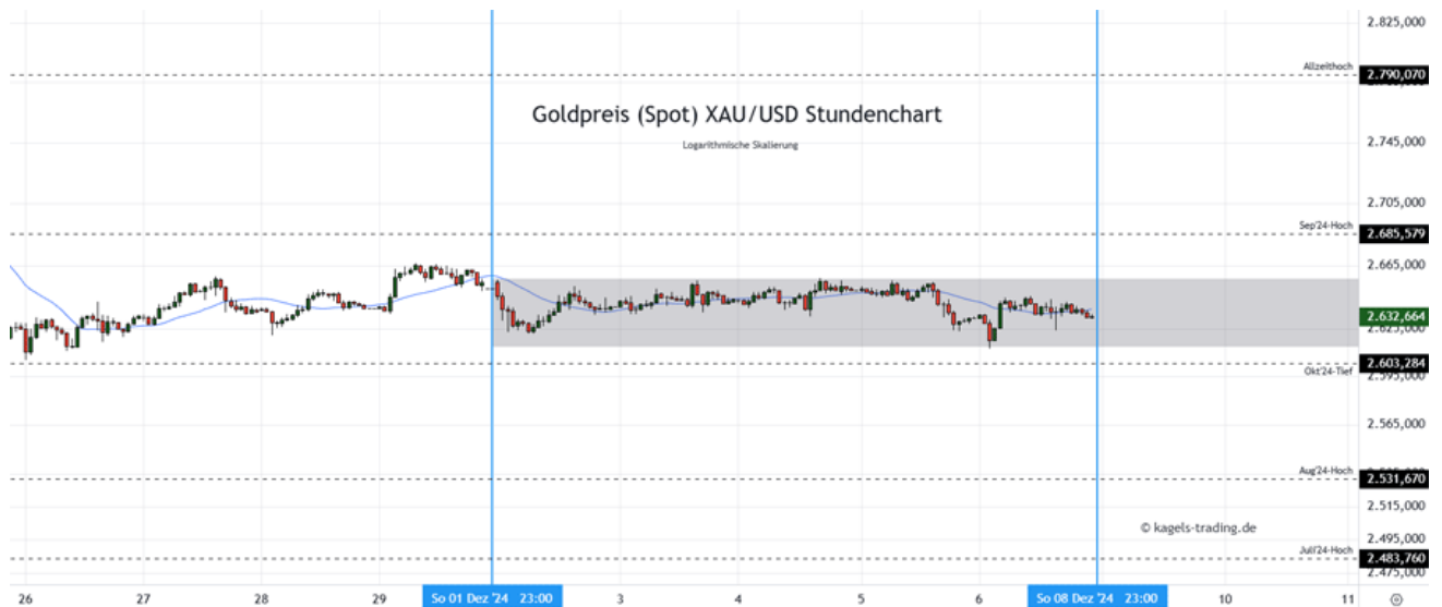
Goldpreis Prognose: Kurs im Stundenchart

In der vergangenen Woche hat der Goldpreis keine deutlichen Impulse gezeigt und eine flache Basis ausgebildet. Hier dürfte ein Ausbruch aus der Vorwochenspanne (grau) den nächsten Richtungsimpuls bilden, an dem sich der weitere Wochenverlauf orientieren würde. Ob bereits am Montag stärkere Bewegung in den Markt kommt, bleibt abzuwarten.