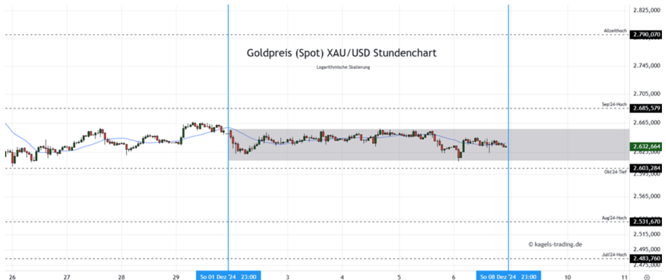
Goldpreis Prognose: Kurs im Stundenchart

In der vergangenen Woche hat der Goldpreis keine deutlichen Impulse gezeigt und eine flache Basis ausgebildet. Hier dürfte ein Ausbruch aus der Vorwochenspanne (grau) den nächsten Richtungsimpuls bilden, an dem sich der weitere Wochenverlauf orientieren würde. Ob bereits am Montag stärkere Bewegung in den Markt kommt, bleibt abzuwarten.