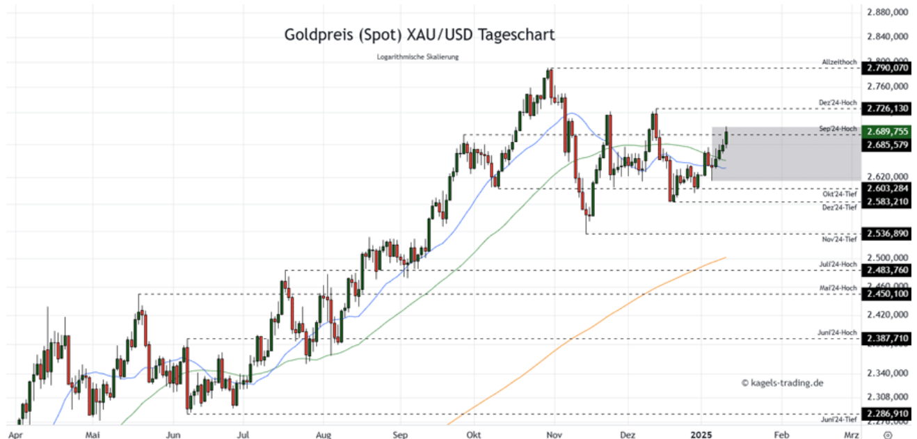
Goldpreis Prognose Tageschart - diese & nächste Woche

➤; Mögliche Wochenspanne: 2690 $ bis 2.790 $